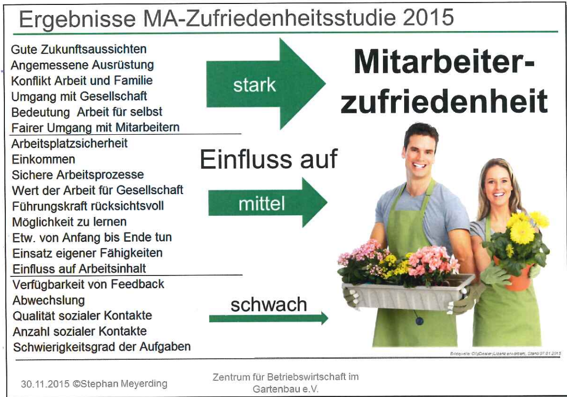
Abbildung 1. Einfluss der Arbeitsmerkmale auf die Arbeitszufriedenheit.