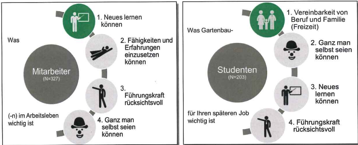
Abbildung 2. Was den jeweiligen Gruppen in Ihrem Job wichtig erscheint